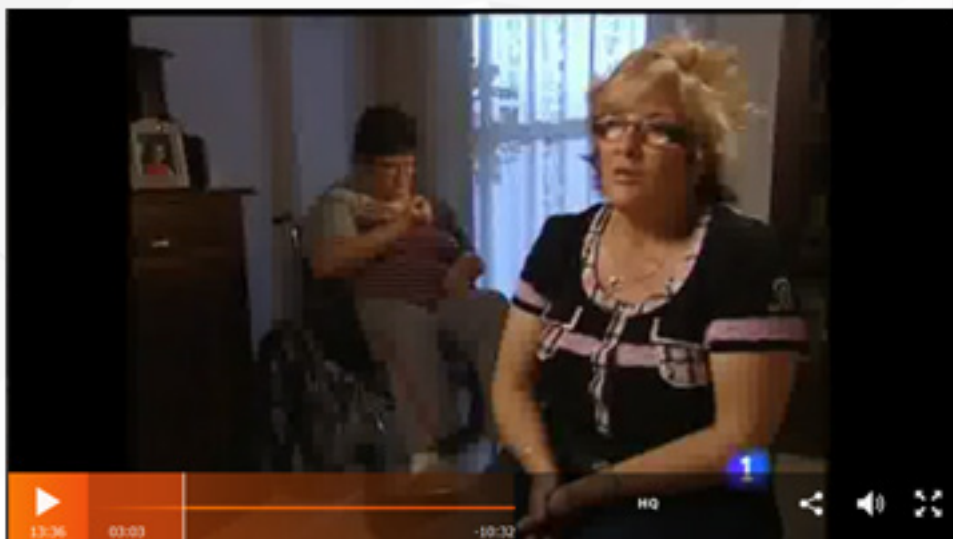
Figura 1. Reportaje Dependientes al límite

Los reportajes de Informe Semanal que abordan la discapacidad recurren frecuentemente a la composición de visualizar, en primer término, a una persona declarando (suele ser un familiar o un profesional) y, en segundo término, al fondo, a la persona/s con discapacidad a la que se está mencionando (Figura 1). Si es un experto el que interviene, las personas que están en segundo término, también pueden ser trabajadores o investigadores del tema tratado. Esta composición da mayor sensación de profundidad y de tres dimensiones.